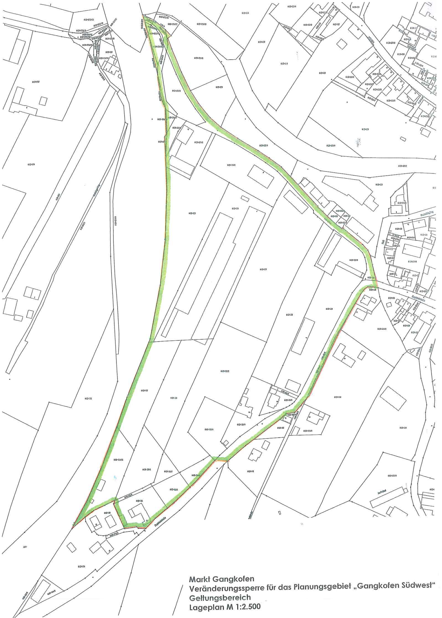
Markt Gangkofen Veränderungssperre für das Planungsgebiet „Gangkofen Südwest“ Geltungsbereich Lageplan M 1:2.500