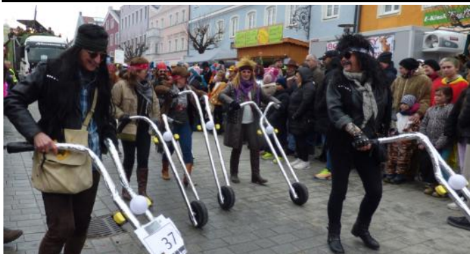
Als Easy Rider zeigte der Donnerstags-Stammtisch das Lebensgefühl der Motorradfahrer.