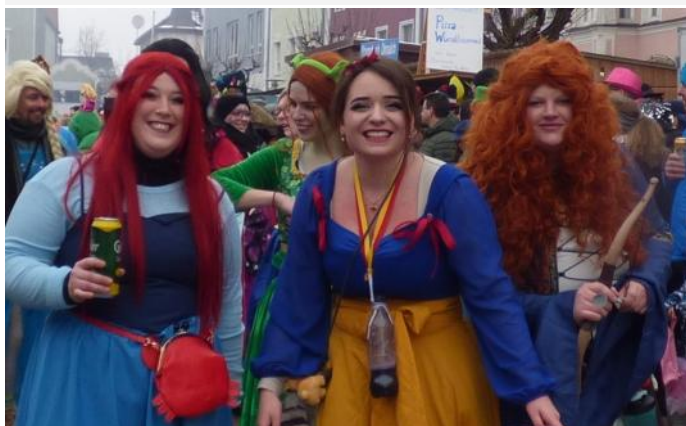
Die Schützengesellschaft Deutsch-Haus jubelte mit ihren Prinzessinnen aus dem Schützenpalast.