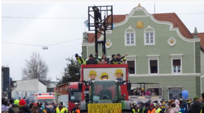
Mit einem riesigen Feuerwehrfahrzeug kam die Landjugend Kollbach zum Faschingszug.