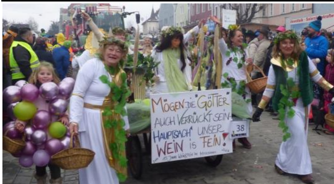
Die Weingötter und Weingöttinnen kamen aus dem Moserhaus.