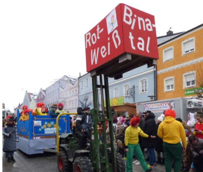
Meister Eder und sein Pumuckl war das Thema der Gruppe "Rot-Weiß Binaltal".