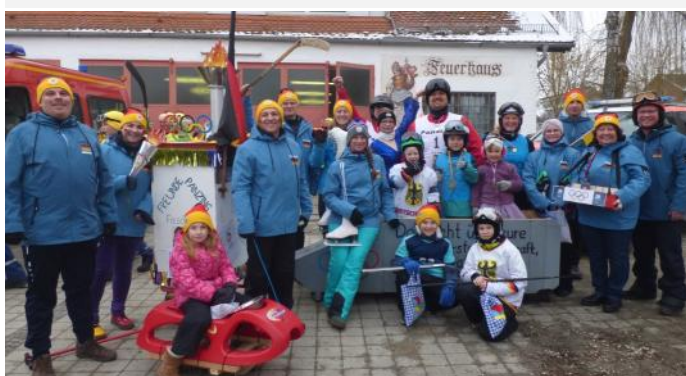
Die Panzinger Faschingsfreunde hatten ihre Spitzensportler für die Olympiade dabei.