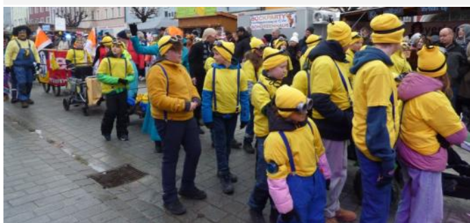
Als Minions begeisterte die Kinder- und Jugendfeuerwehr die zahlreichen Zuschauer am Marktplatz.