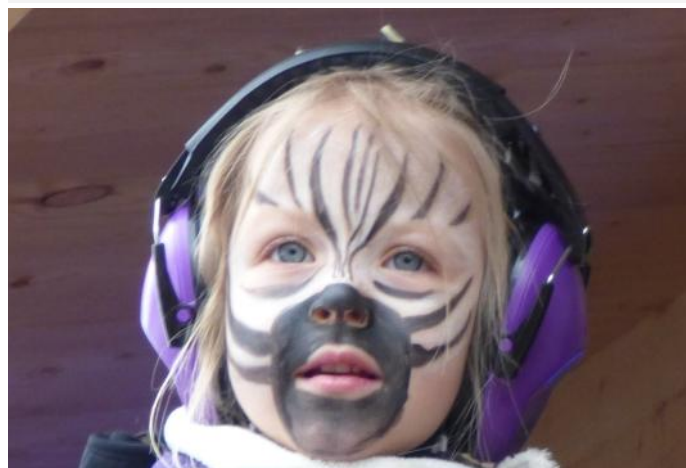
Ideenreich und prächtig maskiert kamen die Besucher zum Faschingszug.