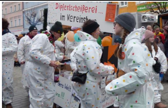
Als "Dipferlscheißer im Vereinshaus" präsentierte sich die Kolpingfamilie.