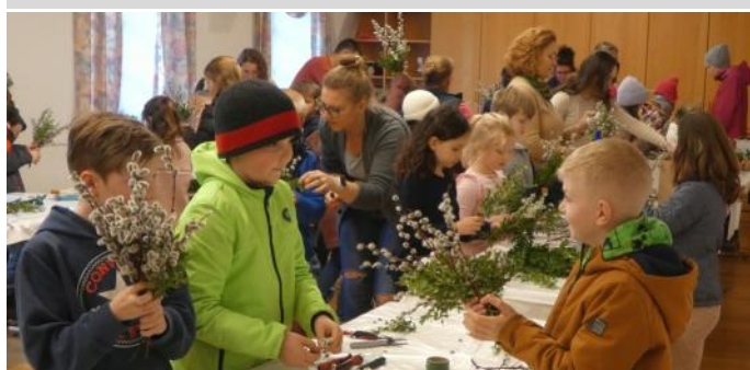
Die Kinder bastelten mit den Pfarrgemeinderäten begeistert ihre Palmbuschen.

Gangkofen. Zahlreiche Kinder folgten der Einladung des Pfarrgemeinderats zum gemeinsamen Palmbuschenbinden am 27. März. Unter Mithilfe der Pfarrgemeinderäte wurden herrliche Palmbuschen für den Palmsonntag gebastelt. Nach katholischem Brauch zur Erinnerung an den Einzug Jesu in Jerusalem werden die Palmzweige während des Gottesdienstes geweiht. Mit den Palmkätzchen und den Palmbuschen ist so mancher Volksglaube verbunden. Oftmals trägt man den „Palmbuschen“ nach der Weihe dreimal ums Haus, um Schutz vor Blitz, Feuer, Krankheit und Unglück zu erbitten. Gesegnete Palmzweige werden auch, mit der Bitte um eine gute Ernte, in den Acker gesteckt.