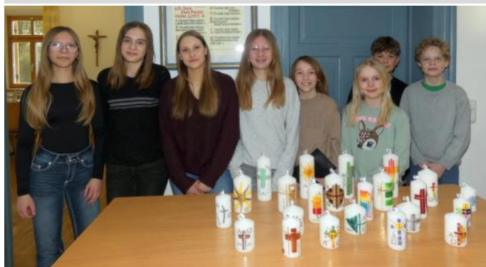
Die Ministranten beim Verkauf der von ihnen gebastelten Kerzen.

Reicheneibach. Mit großer Freude bastelten die Ministranten viele Osterkerzen. Am 15. März nutzten sie die Gelegenheit zum Verkauf im Pfarrheim nach dem Kreuzweg. Dazu bewirteten die Mütter der Messdiener die Gäste mit selbstgebackenen Kuchen sowie Brotzeiten gegen eine Spende. So freuten sich die Ministranten über die Einnahmen, die ausschließlich für sie verwendet werden.