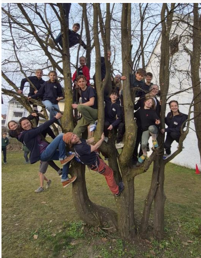
Auch der Spaß durfte bei den Klettertagen nicht fehlen.

schenk. Die Sieger erhielten zudem einen Pokal.