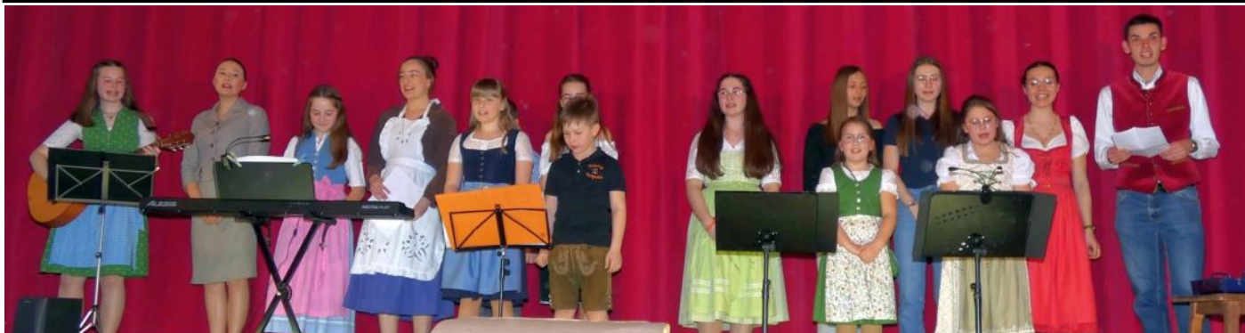
Die Kolpingjugend eröffnete den Abend mit ihrem Lied, in dem sie musikalisch erklärt, was ein "Dipferlscheißer" ist.