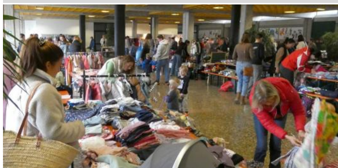
Eine große Vielfalt an guterhaltenem Kinderbedarf bot der Flohmarkt des Elternbeirates der Kindertagesstätte.

Gangkofen. Das Angebot beim Flohmarkt des Elternbeirates der Kindertagesstätte in der Aula der Grund- und Mittelschule am 1. März war erstaunlich, so wurden Baby- und Kinderkleidungsstücke, Kinderschuhe, Babyzubehör wie Autositze, Wippen, Buggys, Kinderwägen, Laufställe oder die verschiedensten Spielwaren geboten. Das weckte einen entsprechend starken Andrang von Besuchern, sei es zum Anschauen oder auch zum Erwerben. „Es ist großartig, dass dieser Flohmarkt immer wieder von den Elternbeiräten organisiert wird. Er ermöglicht es vielen Eltern und Großeltern kostengünstig Artikel für ihre Kinder und Enkel anzuschaffen. Es wäre schade, wenn die meist gut