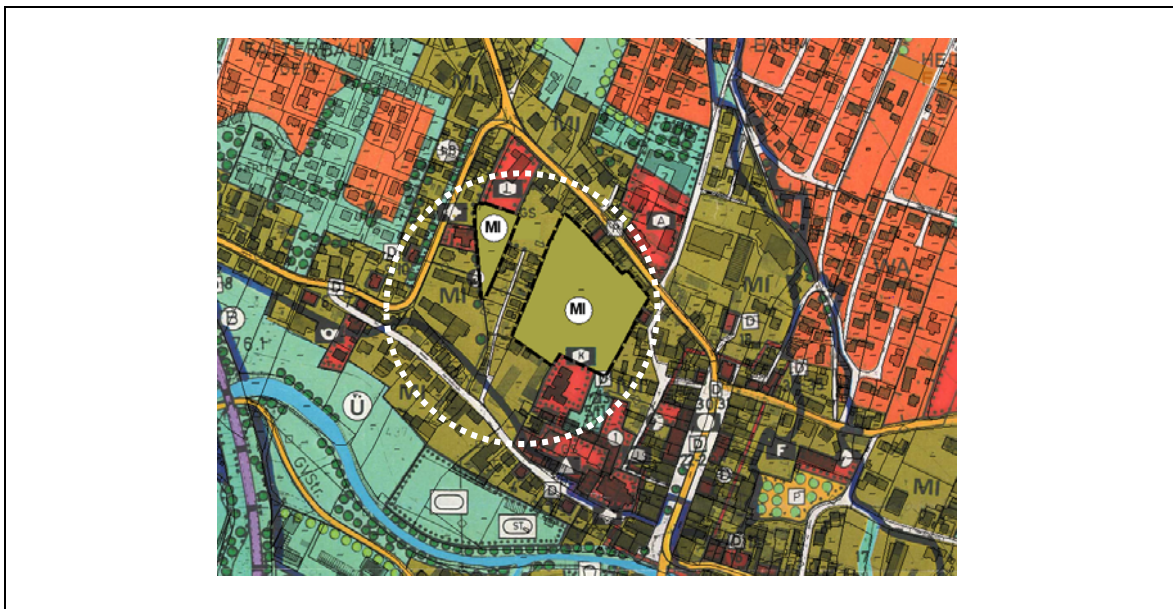
Ausschnitt aus dem Flächennutzungsplan, Deckblatt 33, Parallelverfahren